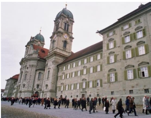
Abbaye d'Einsiedeln

Depuis des années, l'insuffisance des moyens à disposition, qui empêche le développement d'une politique durable de conservation des monuments, et un manque de sensibilisation de la société aux besoins de la conservation du patrimoine et de l'archéologie mettent nos monuments historiques, nos sites construits et nos sites archéologiques à rude épreuve. Le nombre d'objets pour lesquels des subsides sont attribués au titre de la conservation des monuments historiques ne cesse de croître, notamment parce que la valeur des créations de l'architecture du XX e siècle est mieux reconnue. Or, le budget fédéral pour le patrimoine culturel et les monuments historiques subit des coupes sombres depuis 2004, ce qui va à contre-courant. De ce fait, des ressources toujours moins importantes doivent être partagées entre des objets toujours plus nombreux. Notre patrimoine bâti est ainsi de plus en plus menacé.