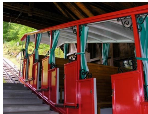
Funiculaire du Giessbach, sur la rive du Lac de Brienz