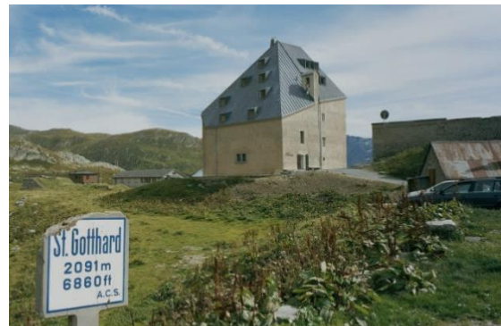
Hospice du Gothard 2010, après la rénovation