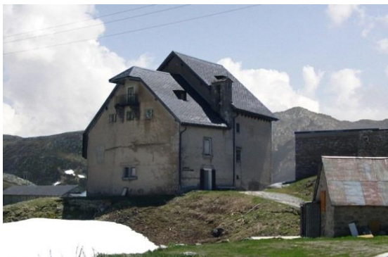
Hospice du Gothard 2005, avant la rénovation © Miller & Maranta, Bâle

Les monuments ont besoin de soins réguliers : Les demandes de subsides déposées par les cantons dépassent de loin les montants budgétés par la Confédération. Pour cette raison, beaucoup de projets de restauration devront être repoussés de plusieurs années. On rate ainsi le moment qui serait idéal pour intervenir, la dégradation des bâtiments s'accroît et menace l'intégrité de précieux objets. Au fil des ans, la situation deviendra de plus en plus délicate, les listes d'attente s'allongeront et le coût des travaux augmentera.